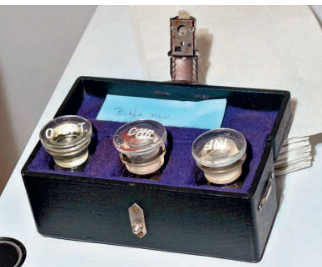
Edle Lederköffcherchen für den sicheren Transport.

Eine grosse 5-dl-Flasche mit rot-weissem Bügelverschluss bringt Priska Rüeeggsegger aus Rothenburg mit. Sie füllt sie zur Hälfte mit Chrisamöl. «Wir haben etwa 25 Täuflinge und 45 Firmlinge pro Jahr», erzählt sie. Für das Krankenöl hat sie ein kleineres Fläschchen dabei. «Am Krankensonntag kommen nicht mehr so viele Leute, um die Krankensalbung zu empfangen.» Nur vereinzelt werde ein Priester zu Menschen gerufen, um dieses Sakrament zu spenden.