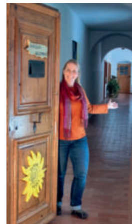
Blick ins ehemalige Kapuzinerkloster.

6.5., 10.00–17.00, Details: sonnenhuegel.org > Aktuelles