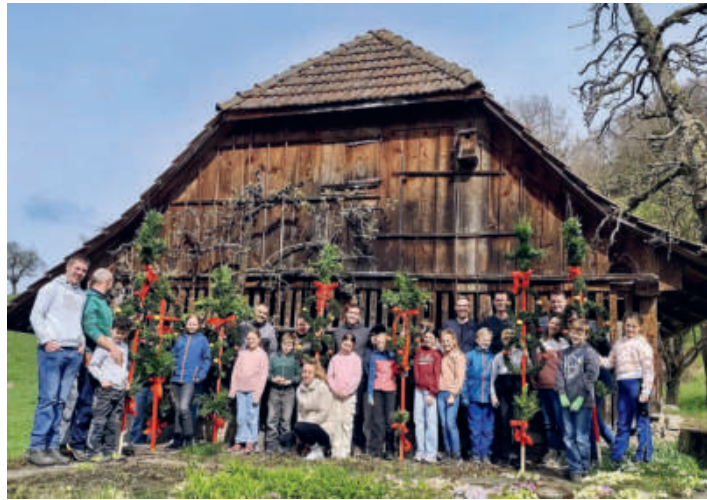
Stolz werden die gemeinsam erstellten Palmen präsentiert.

Die Erstkommunion fand nach Redaktionsschluss statt. Bericht und Bilder dazu finden Sie auf der Webseite.