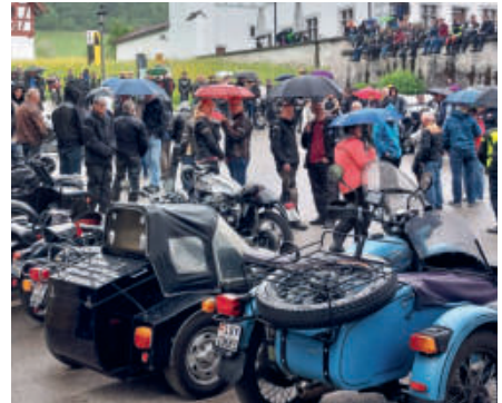
Verregnet: an der Töffsegnung vom vergangenen Jahr in Altishofen.

Töffsegnungen sind für die Freund:innen der motorisierten Fortbewegung auf zwei Rädern Fixpunkte zur Saisoneroöffnung. Im Kanton Luzern gibt es jeweils zwei solche Feiern, in Altishofen und Aesch.