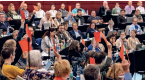
Das Kirchenparlament, die Synode, tagt im Kantonsratssaal in Luzern.

Mi, 6.5., ab 9.30, Kantonsratssaal Luzern