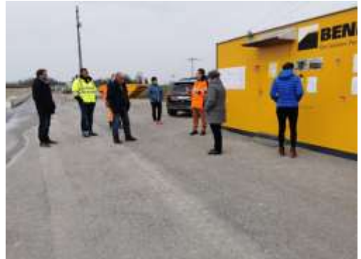
Besuch der Deponie Neuhüsli durch Gemeinderat Ufhusen, Gemeinde Ufhusen

Die Luzerner Landregionen arbeiten für naturnahe Campingplätze mit der Schweizer Plattform Nomady zusammen. Positive Erfahrungen mit Nomady mit Sitz in Einsiedeln SZ, sammelten im Jahr 2020 bereits die UNESCO Biosphäre Entlebuch und die Region Willisau. Auf den Sommer 2021 stossen die Regionen Sempachersee und Seetal dazu. Für landwirtschaftliche Betriebe kann dieses Angebot ein interessanter Nebenerwerb sein.