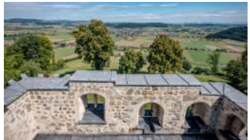
Aussicht von der Burgruine Kastelen

Mögen Sie die Wanderungen lieber auf Papier? Im Tourismusbüro an der Hauptgasse 10 in Willisau erhalten Sie kostenlos verschiedene Wanderkarten mit Tourvorschlägen.