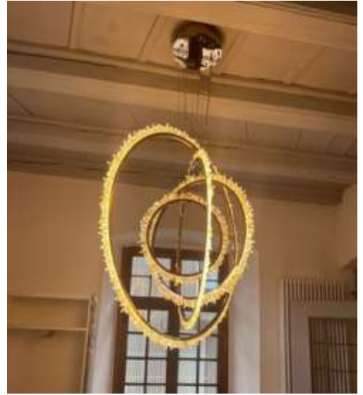
Impressionen verschiedener Leuchten im Schloss