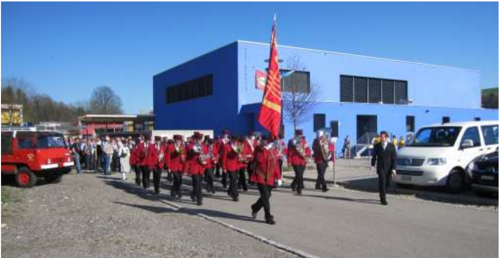
Verschiebung zur Veteranenehrung an der Delegiertenversammlung 2011 in Zell