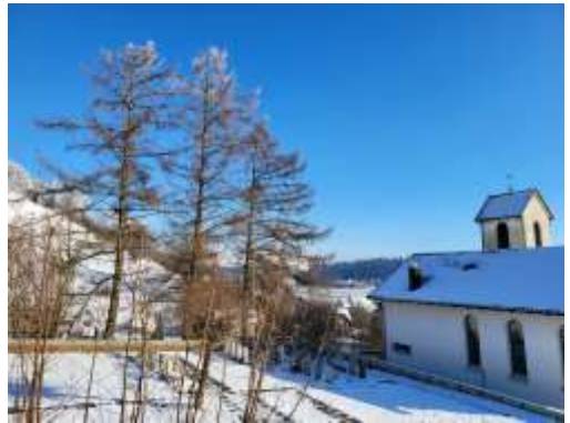
Wintertag in Hüswil (Januar 2024)