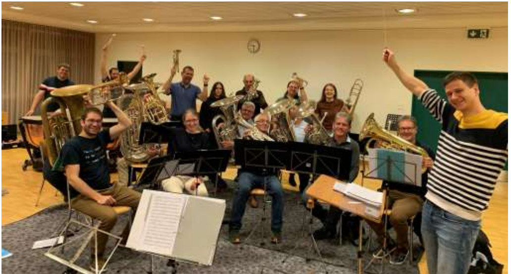
Die Musikgesellschaft freut sich auf das Adventskonzert vom 1. Dezember 2024 mit dem Jodlererzett.

Die Musikgesellschaft und das Jodlererzett freuen sich, Bevölkerung, Freunde und Bekannte am Adventskonzert vom Sonntag, 1. Dezember 2024, 18.00 Uhr in der Pfarrkirche Ufhusen zu begrüßen. Der Eintritt ist frei.