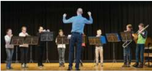
Die Beginnersband Crescendo am letztjährigen Konzert in Geiss.

Es erwartet Sie ein Potpourri aus farbigen herbstlichen Klängen mit verschiedensten Musikformationen. Geniessen Sie einen musikalischen Abend zusammen mit unseren Musikschülerinnen