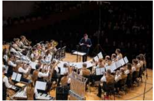
Ufhuser Musikanten spielen auf der grossen Bühne des KKL